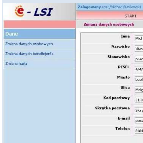
Rys. 6. Poddziały wyświetlone w ramach zakładki „Dane”.

„Zmiana hasła” pozwala na zmianę hasła dostępu do konta w www.elsi.lubelskie.pl .