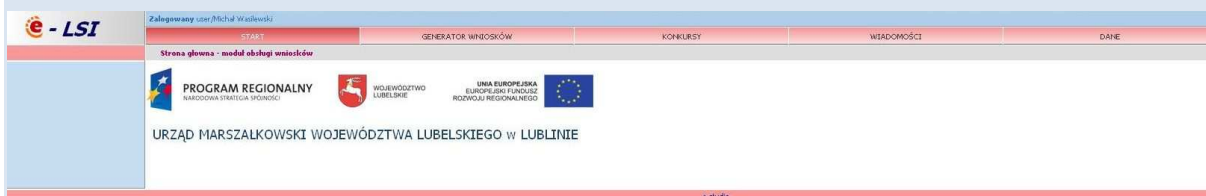
Rys. 4. Wygląd systemu e-LSI po zalogowaniu.

Po poprawnym zalogowaniu się do systemu na górze ekranu pojawia się pasek menu z zakładkami „START” „GENERATOR WNIOSKÓW”, „KONKURSY”, „WIADOMOŚCI”, „DANE”, „WYLOGUJ SIĘ” (Rys. 4).