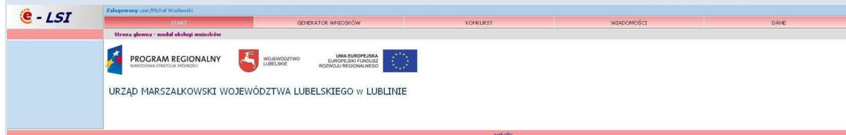
Rys. 4. Wygląd systemu e-LSI po zalogowaniu.

Po poprawnym zalogowaniu się do systemu na górze ekranu pojawia się pasek menu z zakładkami „START” „GENERATOR WNIOSKÓW”, „KONKURSY”, „WIADOMOŚCI”, „DANE”, „WYLOGUJ SIĘ” (Rys. 4).