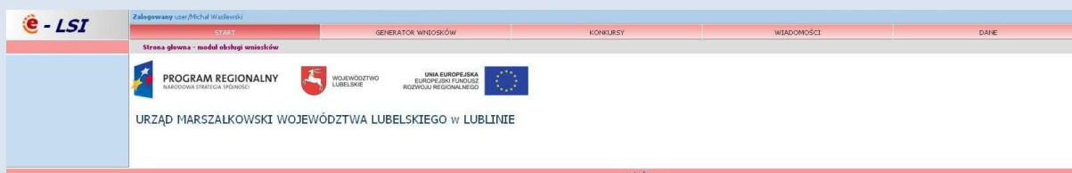
Rys. 4. Wygląd systemu e-LSI po zalogowaniu.

Po poprawnym zalogowaniu się do systemu na górze ekranu pojawia się pasek menu z zakładkami „START” „GENERATOR WNIOSKÓW”, „KONKURSY”, „WIADOMOŚCI”, „DANE”, „WYLOGUJ SIĘ” (Rys. 4).