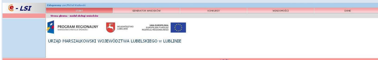
Rys. 4. Wygląd systemu e-LSI po zalogowaniu.

Po poprawnym zalogowaniu się do systemu na górze ekranu pojawia się pasek menu z zakładkami „START” „GENERATOR WNIOSKÓW”, „KONKURSY”, „WIADOMOŚCI”, „DANE”, „WYLOGUJ SIĘ” (Rys. 4).